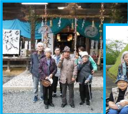
外出行事も行ってます😊