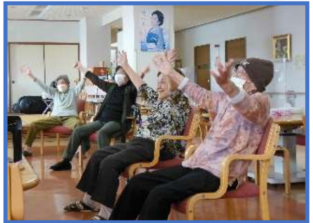
毎日の健康体操で、より元気に！