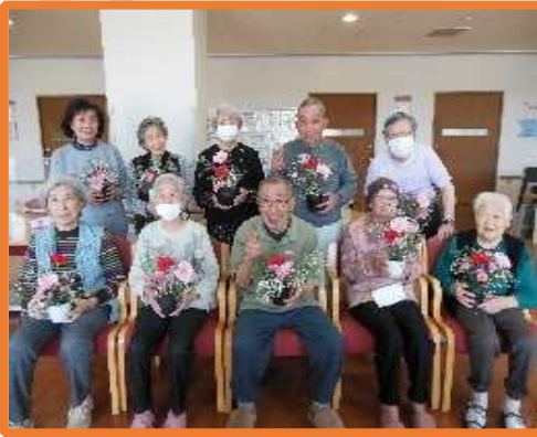
個性が光るフラワーアレンジ