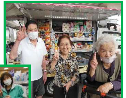
オズメッセやとくし丸で 楽しくショッピング月